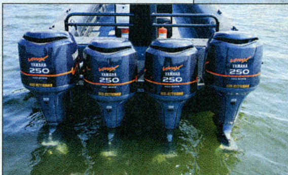
4 st 250 hk 4-taktsmotorer från Yamaha borgar för en extrem prestanda med sina totalt 1000 hästkrafter.

Det är här är det mest extrema jag någonsin varit med om! Det har varit mycket roligt för grab-